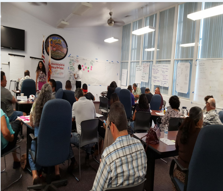
El personal participó en la reunión de Trabajo en Grupo del 22 de Agosto en Orosi para el Proyecto de LEFA del Condado de Tulare