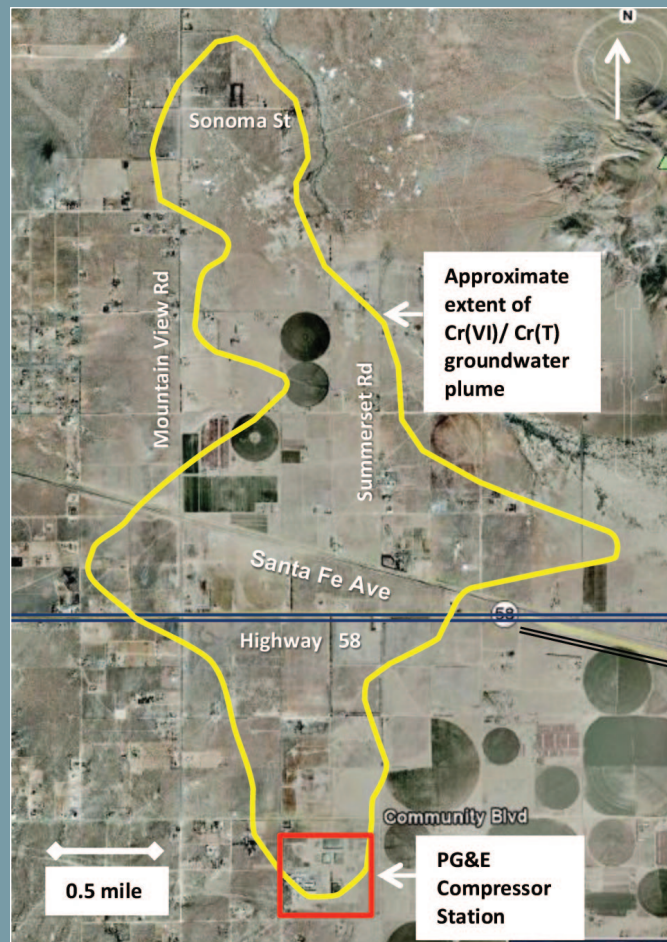
Chromium Plume Extent in Hinkley Groundwater, Summer 2011

El mapa de la estela de cromo correspondiente al tercer trimestre del 2011 se puede ver en el sitio en la red de la Dirección Regional de Aguas Laontan.